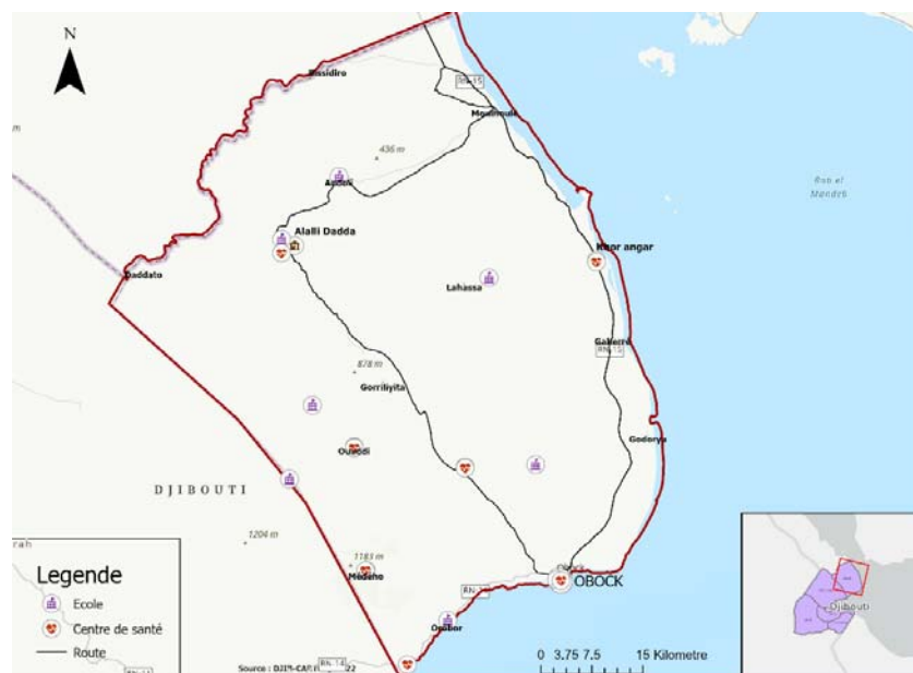
Carte 3 : carte des principales infrastructures de la région d'Obock

La région d'Obock souffre d'une insuffisance d'infrastructures routières et d'un manque de mobilité entre les communautés rurales et le chef-lieu, qui constitue un obstacle important au développement local pour la région. Certaines pistes reliant les différentes localités telle que (Médeho jusqu'à Obock et Allaili Dadda) sont difficilement accessibles pour une circulation ou un accès des biens de transport.