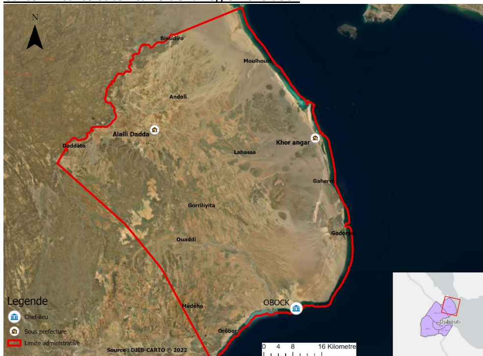
Carte 1 : carte satellitaire de la région d'Obock

Elle dispose aussi d'une frontière terrestre partagée avec l'Erythrée, et une autre maritime avec le Yémen ainsi que plus de 100 km de côtes le long du détroit de Bab el Mandeb, du Golfe de Tadjourah et du Golfe d'Aden. Elle présente une situation géo-touristique importante et inexploitée ; un ensemble de plages avec une nappe d'eau très salée, ses mangroves sauvages du Godoria et de Khor-Angar et ses fonds sous-marins peuplés d'innombrables espèces de poissons.