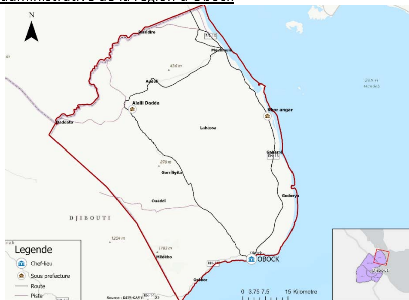
Carte 4 : carte administrative de la région d'Obock