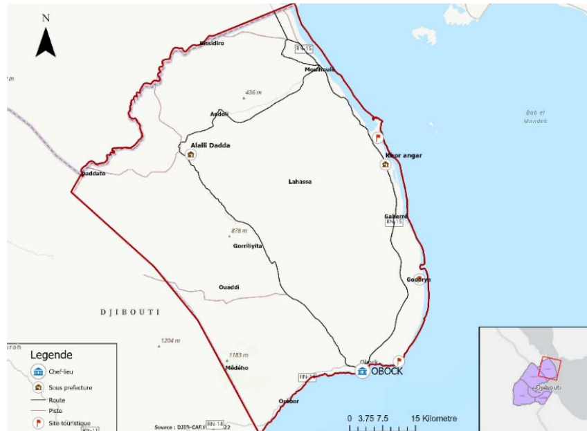
Carte 2 : sites d'intérêt régionaux